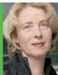
Tabea Rößner, MdB Sprecherin für Medien und Demografie der Bundestagsfraktion von BÜNDNIS 90/DIE GRÜNEN